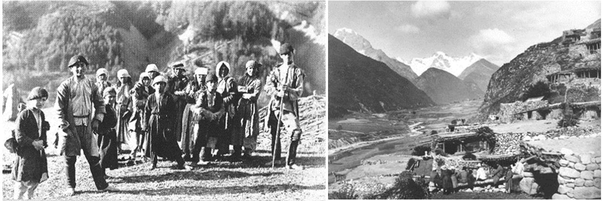
ნახ. 4. სვანური სოფლები და მოსახლეობის ყოფა-ცხოვრება XIX საუკუნის ბოლოს

1983 წელს იტალიაში გამოიცა ფოტოალბომი, რომელშიც მოთავსებულია სხვა მთიან სისტემებთან ერთად ცენტრალური კავკასიონის მწვერვალების, უღელტეხილების, მაღალი მთის სოფლების მცხოვრებთა საქმიანობისა და მათი ჩაცმულობის გამომხატველი სურათები, რომლებიც გადაღებულია ვიტორიო სელას მიერ 1889, 1890 და 1896 წლებში [3].