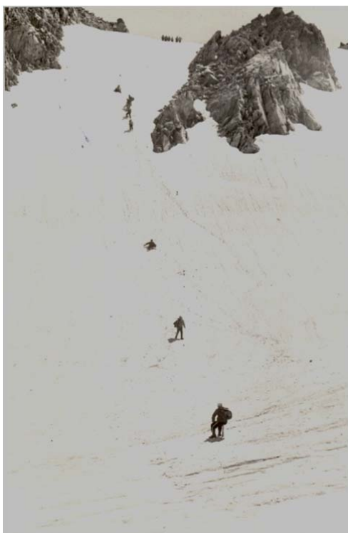
ნახ. 3. ექსპედიციის წევრების დაშვება გურძიეცეკის უღელტეხილიდან (კავკასიონის ჩრდილო ფერდობი)

მიზანშეწონილია აღნიშნული მარშრუტის კიდევ ერთხელ გავლა და შესწავლა, რითაც დეტალურად დადგინდება გზა სოფ. გლოლაიდან (ონის მუნიციპალიტეტი) ძინაღამდე (დიგორის რ-ნი, ჩრდილო ოსეთი), ან, პირიქით, ძინაღიდან გლოლაამდე. მოხდება ტურისტული ობიექტების მეცნიერული აღწერა, ფოტო- და ვიდეოგადაღება. ამ მარშრუტის გასწვრივ შესწავლილ იქნა ბუნებისა და მატერიალური კულტურის ყველა ძეგლი და შერჩევის შემდეგ მოხდება მათი ტურისტულ მარშრუტში ჩართვა.