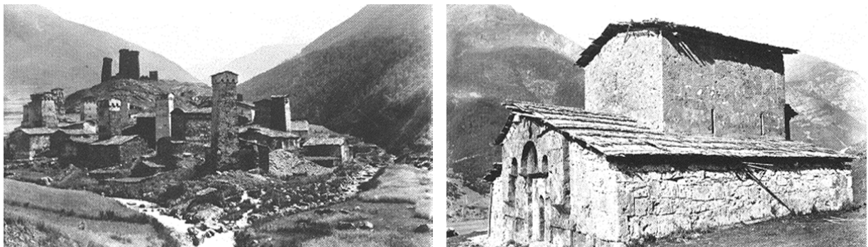
ნახ. 5. სოფ. უშგული და ეკლესია XIX საუკუნის მიწურულს

შემდგომში (1989 წ.) იტალიასა და ბევრ სხვა ქვეყანაში ცნობილი ბანკის „ვიტორიო სელას“ პრეზიდენტმა ლუდოვიკო სელამ გადაწყვიტა გამოეცა ფოტოალბომი, რომელშიც მოთავსებული იქნებოდა 100 წლის შემდეგ გადაღებული სურათები ცენტრალური კავკასიონის იმ ადგილებისა, რომლებიც დაფიქსირებული იყო ვიტორიო სელას მიერ საქართველოში მოგზაურობის დროს. აღნიშნული ჩანაფიქრი საშუალებას იძლეოდა გაგვეჩვენა, თუ რა ცვლილებები განიცადა 100 წლის განმავლობაში კავკასიონის გეოგრაფიულმა გარემომ და მაღალი მთის სოფლების მოსახლეობის ყოფა-ცხოვრებამ.