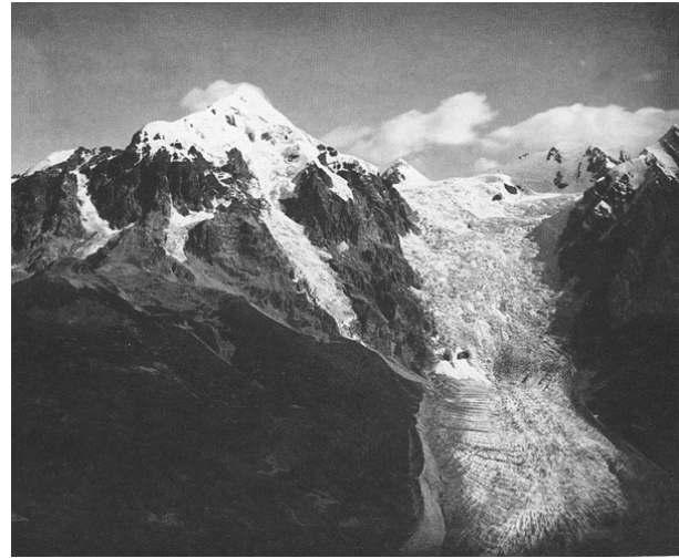
ნახ. 6. უშბა და აღიშის მყინვარი XIX საუკუნის მიწურულს

ექსპედიციამ, რომელიც ერთ თვეს გაგრძელდა და, რომლის შემადგენლობაში იტალიელებთან ერთად შედიოდა გეოგრაფიის ინსტიტუტის სამი თანამშრომელი, გაიარა კავკასიონის ქედის მონაკვეთი მყინვარწვერიდან იალბუზამდე და გადაღებულ იქნა თითქმის ყველა ობიექტი, რომლებიც იყო პროგრამით გათვალისწინებული. პარალელურად ჩატარდა გავლილი მარშრუტის სამეცნიერო ხასიათის ვიზუალური დათვალიერება, რის საფუძველზეც ექსპედიციის მონაწილეებს გაუჩნდათ სურვილი კვლავაც ჩატარებულიყო აღნიშნული მარშრუტის დეტალური გამოკვლევა და კავკასიონის ქედის ეს მონაკვეთი (მარშრუტი) სახელწოდებით „ვიტორიო სელას ნაკვალევზე“ ჩართულიყო სამთო ტურიზმის საერთაშორისო ქსელში.