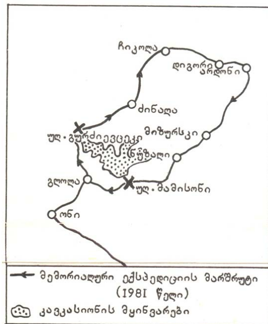
ნახ. 2. 1981 წელს ვახუშტი ბაგრატიონის სახელობის გეოგრაფიის ინსტიტუტის მემორიალური ექსპედიციის მიერ გავლილი მარშრუტი

1981 წელს ზემოაღნიშნული მარშრუტი (ნახ. 2) გაიარა ვახუშტი ბაგრატიონის სახელობის გეოგრაფიის ინსტიტუტის მემორიალურმა ექსპედიციამ (14 კაცის შემადგენლობით), რომელმაც მეცნიერულად აღწერა მარშრუტი, შეისწავლა ბუნებისა და ხუროთმოძღვრული ძეგლები, შეადგინა სქემები და დიაგრამები, მოახდინა გავლილი გზის ფოტო- და კინოგადაღება, მოინიშნა მემორიალის დასადგმელი ადგილი, ღამის გასათევი ადგილები და ბილიკები. მიუხედავად ამისა, იმ დროს ვერ მოხერხდა მემორიალის დადგმა და ამ მარშრუტის ჩართვა ტურისტულ ქსელში [2].