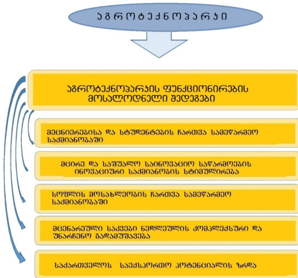
ნახ. 2. აგროტექნოპარკის ფუნქციონირების (საქმიანობის) მოსალოდნელი შედეგები

სახელმწიფოს მხრიდან პარტნიორის როლი აგროტექნოპარკში უნდა შეასრულოს საქართველოს სოფლის მეურნეობის მეცნიერებათა აკადემიამ, რომელიც ფუნდამენტური და გამოყენებითი მეცნიერებების დაახლოებისა და ოპტიმიზაციის მიზნით სასურველია შეუერთდეს საქართველოს ეროვნულ აკადემიას, რასაც ზოგადად დიდი მნიშვნელობა აქვს ქვეყნის ინოვაციური განვითარებისათვის.